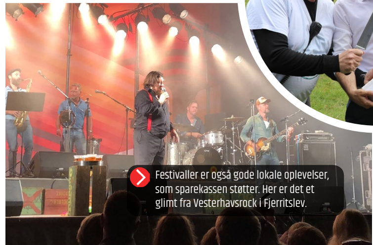
Festivaler er også gode lokale oplevelser, som sparekassen støtter. Her er det et glimt fra Vesterhavsrock i Fjerritslev.