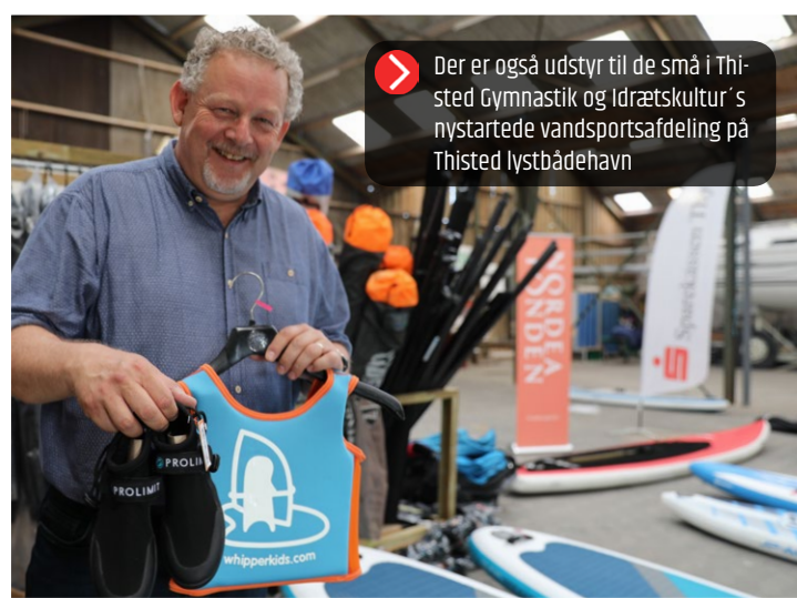
Der er også udstyr til de små i Thisted Gymnastik og Idrætskultur's nystartede vandsportsafdeling på Thisted lystbådehavn