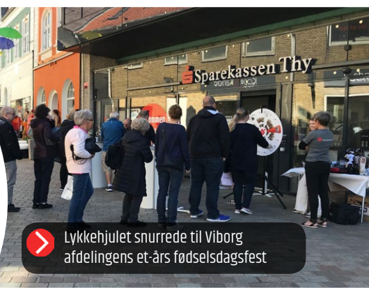
Lykkehjulet snurrede til Viborg afdelingens et-års fødselsdagsfest