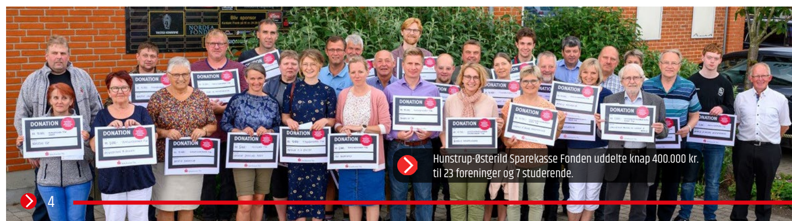
Hunstrup-Østerild Sparekasse Fonden uddelte knap 400.000 kr. til 23 foreninger og 7 studerende.