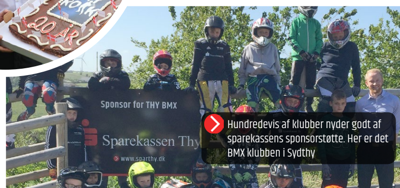
Hundrevis af klubber nyder godt af sparekassens sponsorstøtte. Her er det BMX klubben i Sydthy