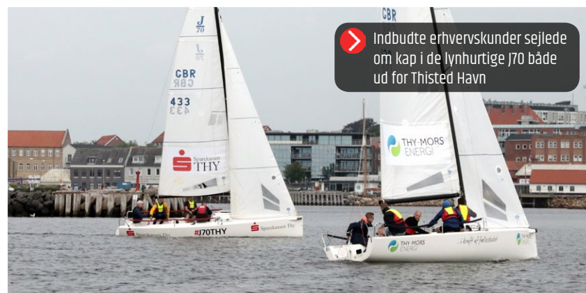
Indbudte erhvervskunder sejlede om kap i de lynhurtige J70 både ud for Thisted Havn