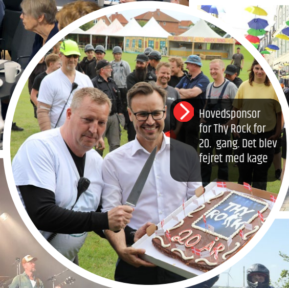
Hovedsponsor for Thy Rock for 20. gang. Det blev fejret med kage